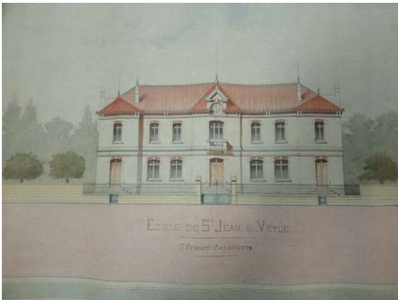
Figure 6 - Plan de l'école (1888) (M3)

devis, marché de gré à gré, procès-verbal de réception, plans, correspondance (1969-1970, 1978-1981).