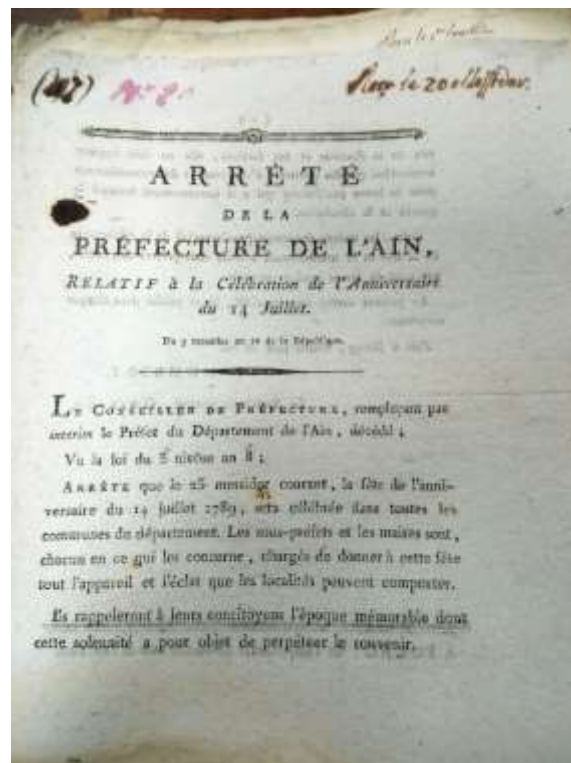
Figure 4 - Arrêté préfectoral relatif à la célébration de l'anniversaire du 14 juillet (an X) (H7)