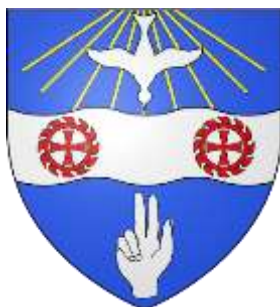
Figure 2- Blason "d'azur à la fascée ondée d'argent chargée de deux roues de moulin de gueules dont les rayons sont deux croix pattées, surmontée d'une colombe du Saint Esprit aussi d'argent dans un rai de soleil d'or et soutenue d'une main bénissante d'argent"

La commune de Saint-Jean-sur-Veyle est située dans le canton de Vonnas et est membre de la Communauté de communes de la Veyle.