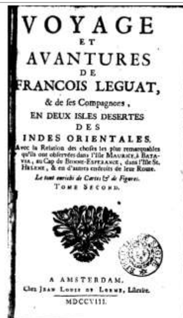
Figure 3 - Couverture de Voyage et aventures de François Leguat

Saint-Jean-sur-Veyle est le berceau de François Leguat (vers 1637-1735), explorateur et écrivain protestant. Exilé en Hollande en 1689, il fait partie d'une expédition visant à coloniser l'île de Mascareigne (île de la Réunion actuelle) par onze réfugiés huguenots. Leur voyage est finalement détourné sur l'île Rodrigues. Abandonnés, ils quittent l'île près de deux années plus tard et rejoignent l'île Maurice en 1693 où ils sont emprisonnés. Ils sont ensuite conduits à Batavia (Jakarta actuelle) en 1696 puis reviennent, à seulement trois membres d'équipage, en Europe en 1698. Domicilié à Londres, où il décède en 1735, il y rédige son ouvrage Voyage et aventures de François Leguat & de ses compagnons en deux isles désertes des Indes orientales, avec la relation des choses les plus remarquables qu'ils ont observées dans l'Isle Maurice, à Batavia, au Cap de Bonne-Espérance, dans l'isle de St. Hélène & en d'autres endroits de leur route , imprimé en 1708.