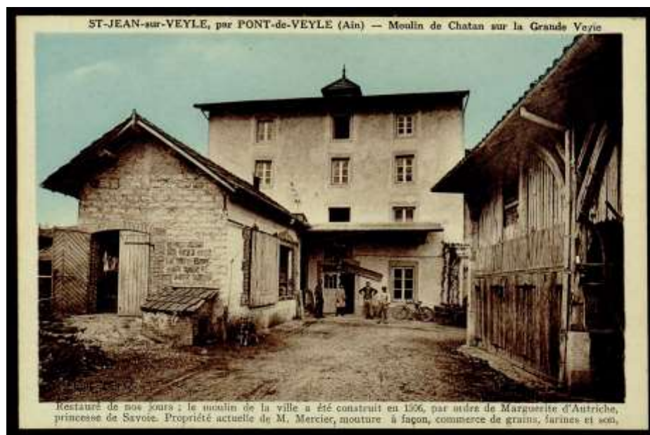
Figure 8 - Moulin de Chatan (Archives départementales de l'Ain - 5 Fi 365 / 0005)

Barrages. - Réparation d'une vanne : correspondance (1853). Récolement : état des frais (1856). Construction : règlement d'eau, procès-verbal de récolement, arrêté préfectoral, enquête publique, rapport, correspondance (1865-1869). Réglementation, élaboration : enquête publique, correspondance (1875, 1891). Projet de construction : devis (1897).