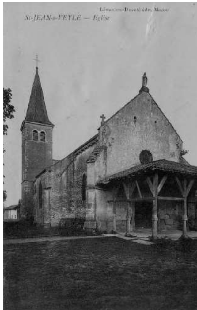
Figure 7 - Eglise de Saint-Jean-sur-Veyle

Cimetière, translation et construction d'un mur de clôture : rapports, devis, délibération, arrêté préfectoral, plans, correspondance (1872-1878). Agrandissement : arrêté préfectoral, procès-verbal descriptif, plan, correspondance (1918-1920).