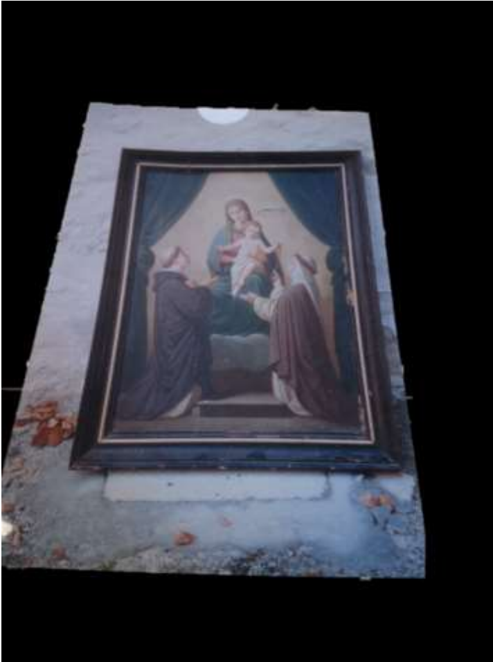
Figure 7-Tableau "Vierge au Rosaire" (10W8)