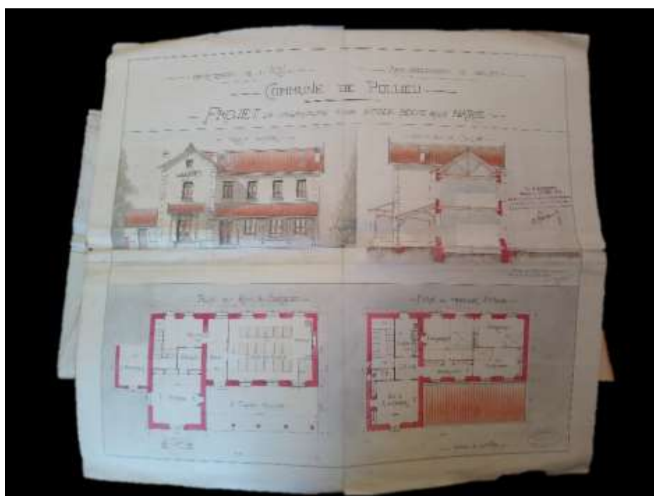
Figure 4-Plan de la maison d'école (M1)