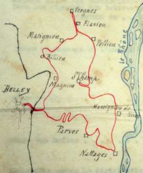
Figure 5-Projet de poste automobile (1934, 04)

Perception des mandats ordinaires jusqu'à 500 francs.