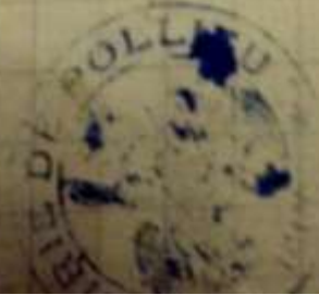
Figure 3-Etat nominatif des habitants ayant effectué des prestations aux FFI (1945, H4)