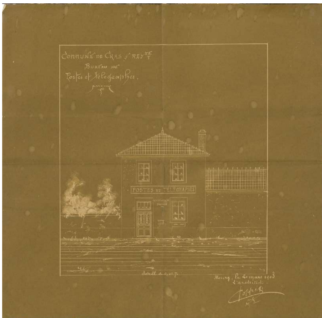
Figure 4 – Plan pour la construction du bureau de poste, 1M2 (1903).