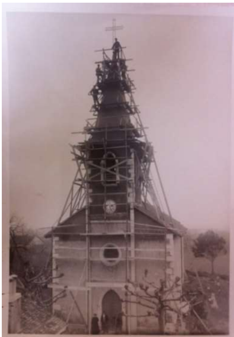
Figure 3 Église de Cessy, réparations de la toiture (2M1), 1935