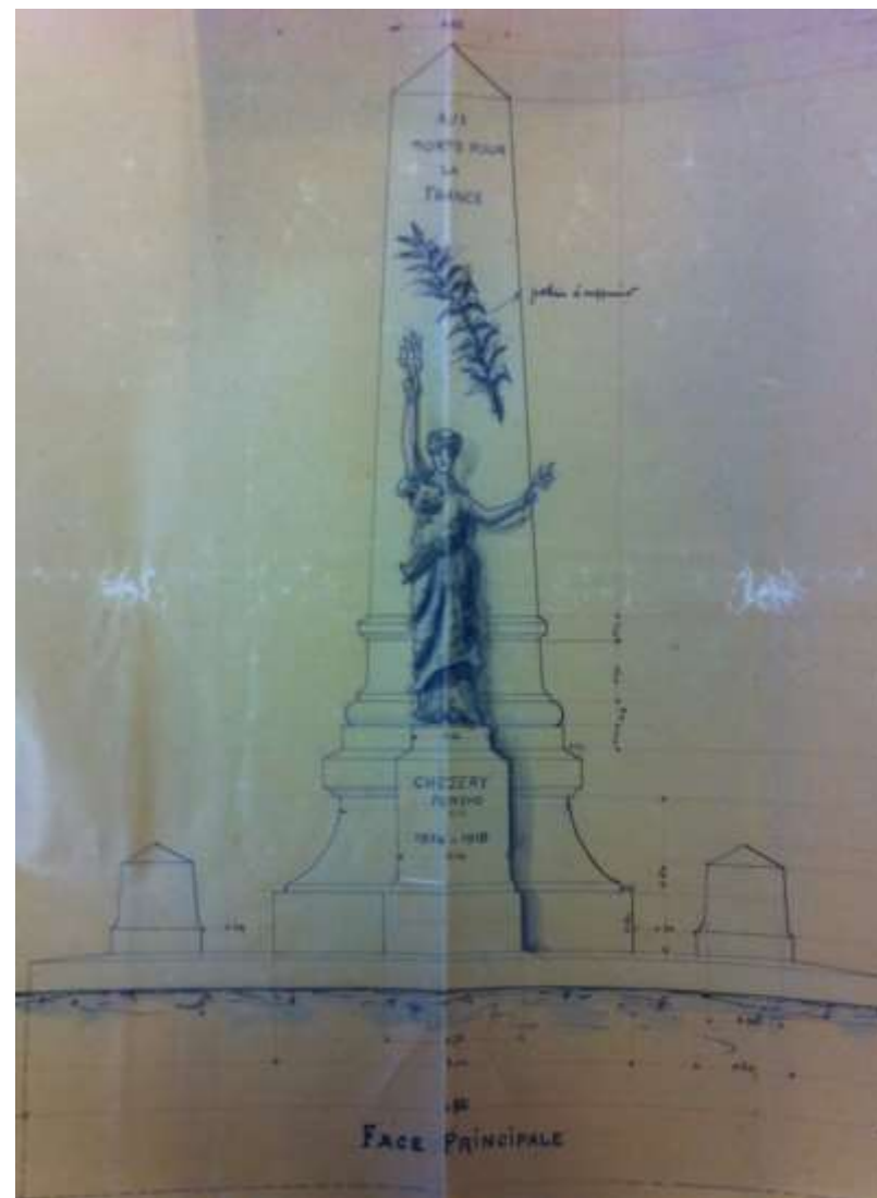
Figure 3 Plan du monument aux morts (1919), M2